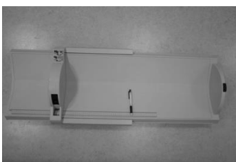
図1. 測定用ベビーボードの全景