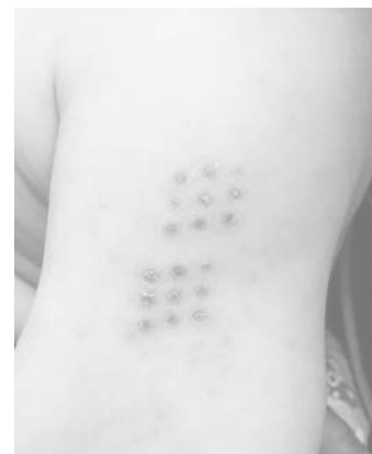
（写真）BCG接種から約2か月後赤く盛り上がったぶつぶつが見られます