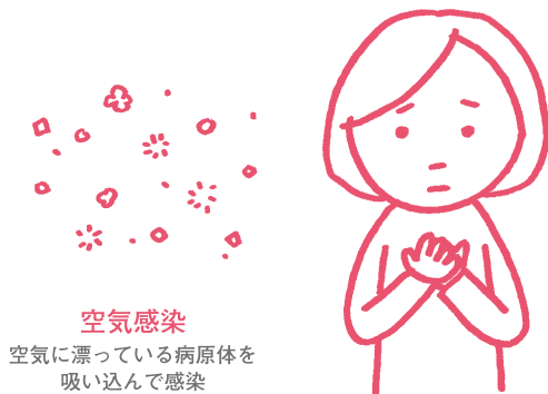
空気感染 空気に漂っている病原体を吸い込んで感染

結核の原因菌は結核菌です。主に、結核菌が空気にただよい、それを肺の中に吸い込むことで感染します。結核菌が体の中に入ってもすべての人が発病するわけではありません。病気になるかどうかは、菌をもらった人の免疫と菌の量などの力関係によります。また、免疫力が衰えた時に体の中に潜んでいた結核菌が活動を開始して病気をおこすこともあります。