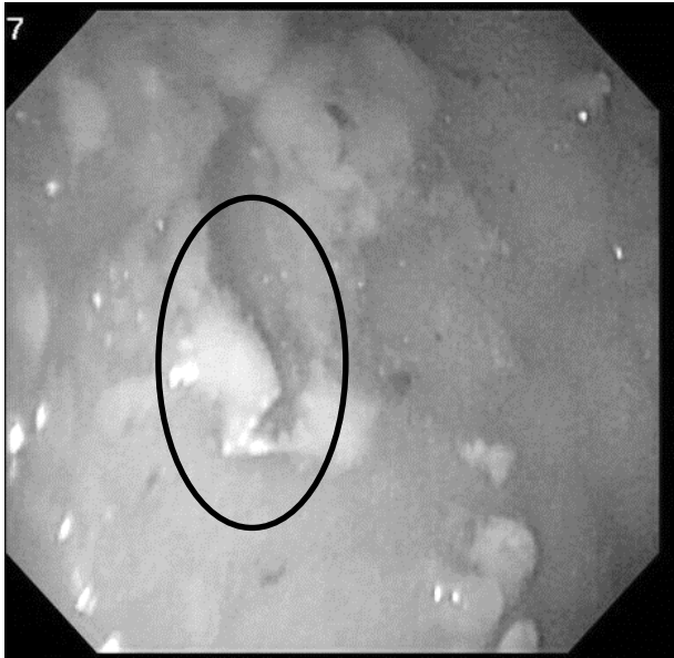
【図2】上部消化管内視鏡画像 : 食物残渣に紛れる金属片 (円内)