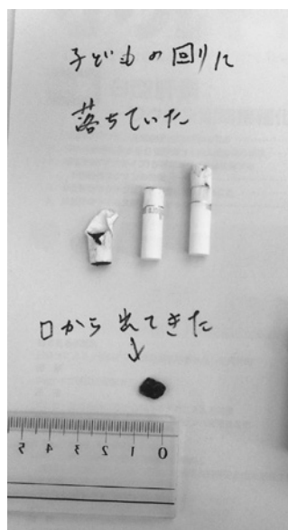
図1 発見時に患児の周囲に落ちていた加熱式タバコのスティックと口の中から出てきた塊