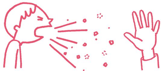
飛沫感染 咳やくしゃみで飛び散った病原体を吸い込んで感染

菌は空気の通り道に入り込み、中耳炎や肺炎などを引き起こすことがあります。まれに粘膜から血液の中に入り、髄膜炎（脳を包んでいる膜に炎症がおこる病気）、菌血症（細菌が血液の中に入った状態）、敗血症（細菌による血液の感染症で、全身の状態が悪くなる病気）などの重い感染症となり、これらは「 侵襲性肺炎球菌感染症 」と呼ばれています。